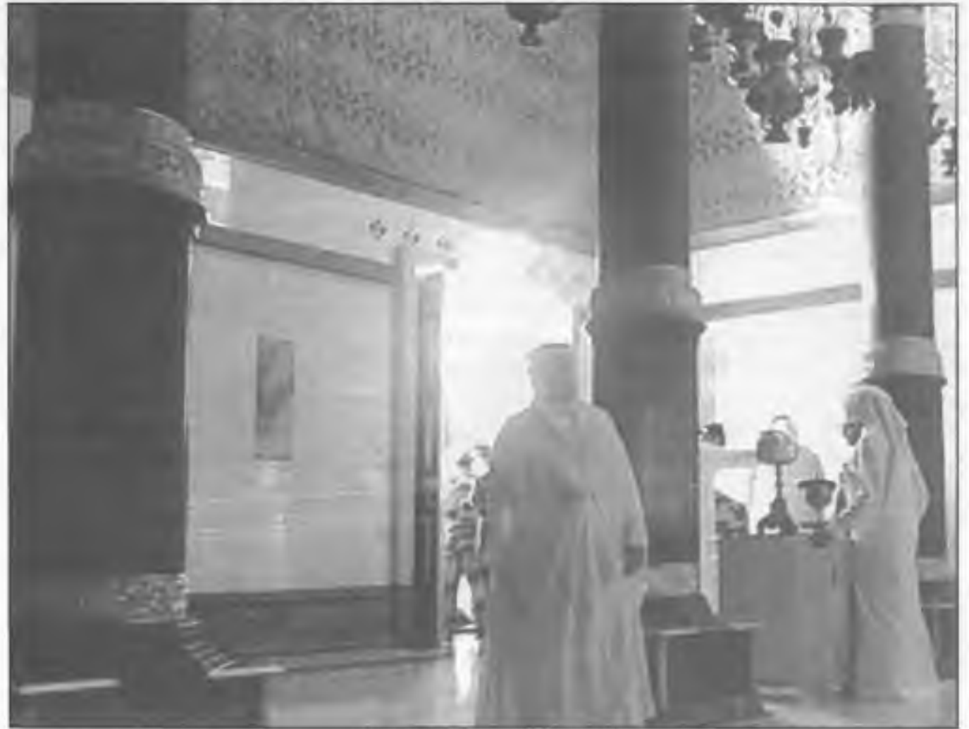
□ وهذه الصورة النادرة للكعبة من الداخل □