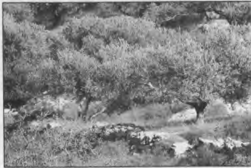
شجرة الزيتون المباركة

وقد أظهرت دراسة نشرت في مجلة اللانست الشهيرة في ٢٠ ديسمبر ١٩٩٩ أن معدل الوفيات في أفقر بلد في أوروبا ألا وهي البانيا المسلمة تمتاز بانخفاض معدل الوفيات فيها، فمعدل الوفيات في البانيا عند الذكور كان ٤١ شخصاً من كل ١٠٠٠ شخص، وهو نصف ما هو عليه الحال في بريطانيا. ويعزو الباحثون سبب تعميم الناس في البانيا ذات الدخل المحدود جداً إلى نمط الغذاء عند الألبانيين، وقلّة تناولهم للحوم ومنتجات الحليب، وكثرة تناولهم للفواكه والخضار والنشويات وزيت الزيتون. فقد كان أقل معدلات الوفيات في الجنوب الغربي من البانيا في المكان الذي كانت فيه أعلى نسبة لاستهلاك زيت