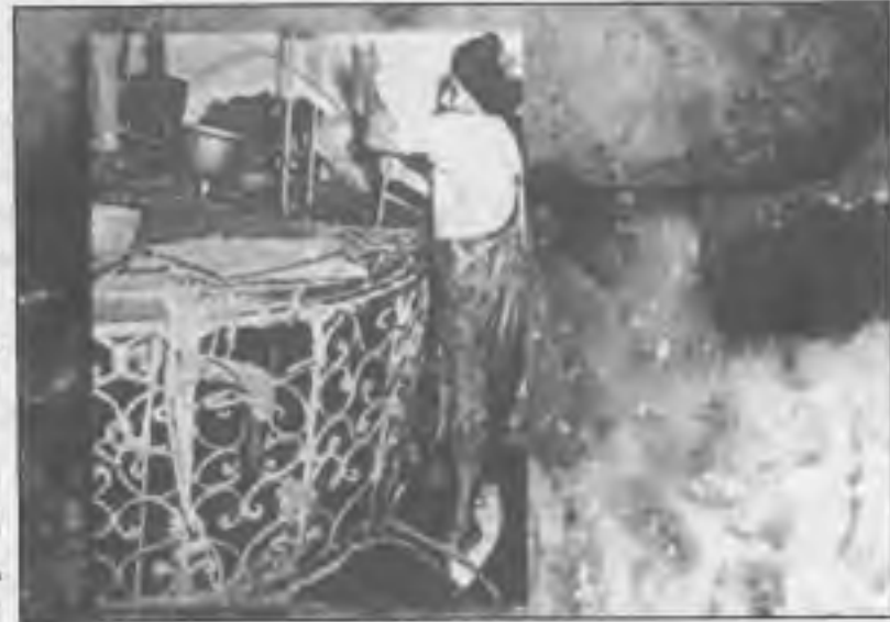
صورة قديمة لبئر زمزم