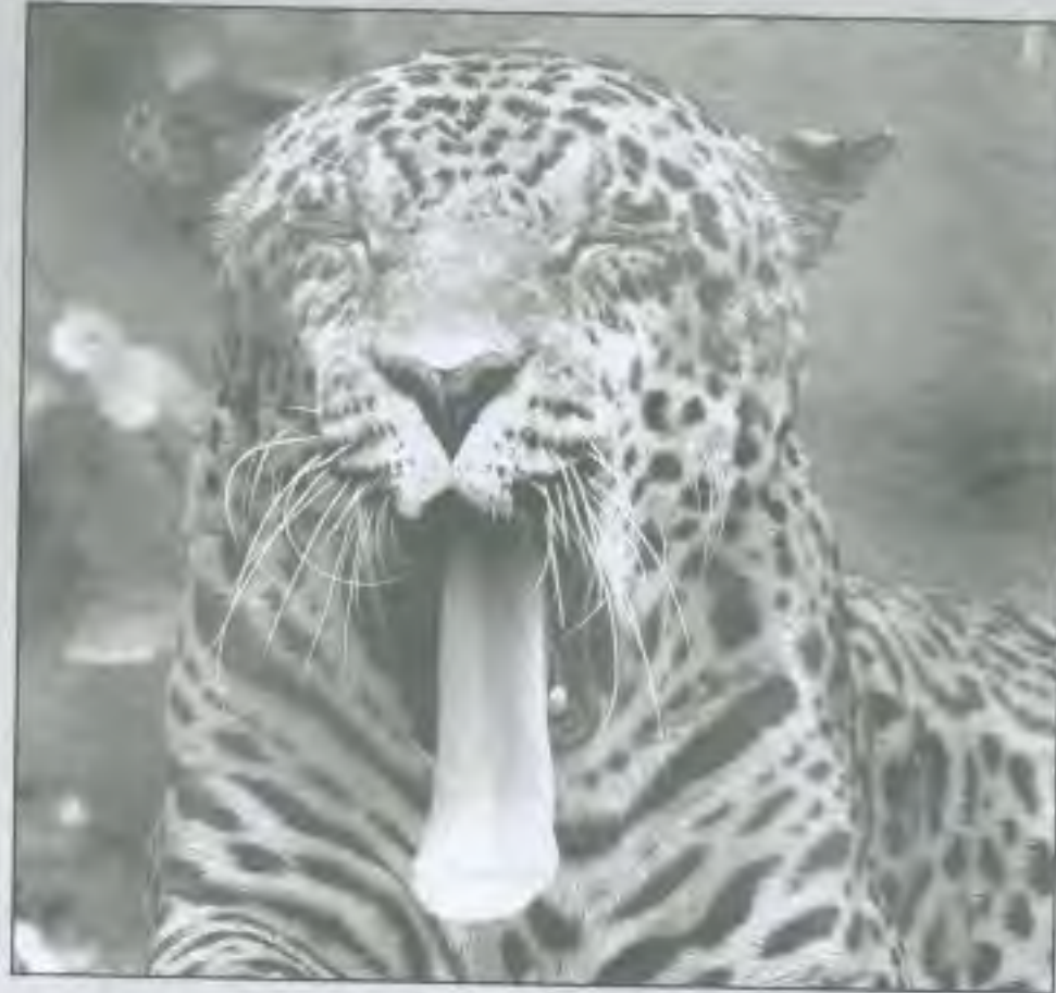
□ الفرحيون يتناوبون □

الاصطلاح في هذا لا يخرج عن المعنى اللغوي. المصباح المنير: مادة (تَوَب) التَّوَابُ - التَّوَابُ (١). وللتناوب في تعريفه العلمي صيغ عديدة منها: